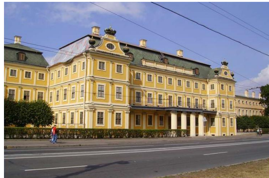
Меншиковский дворец в Санкт-Петербурге