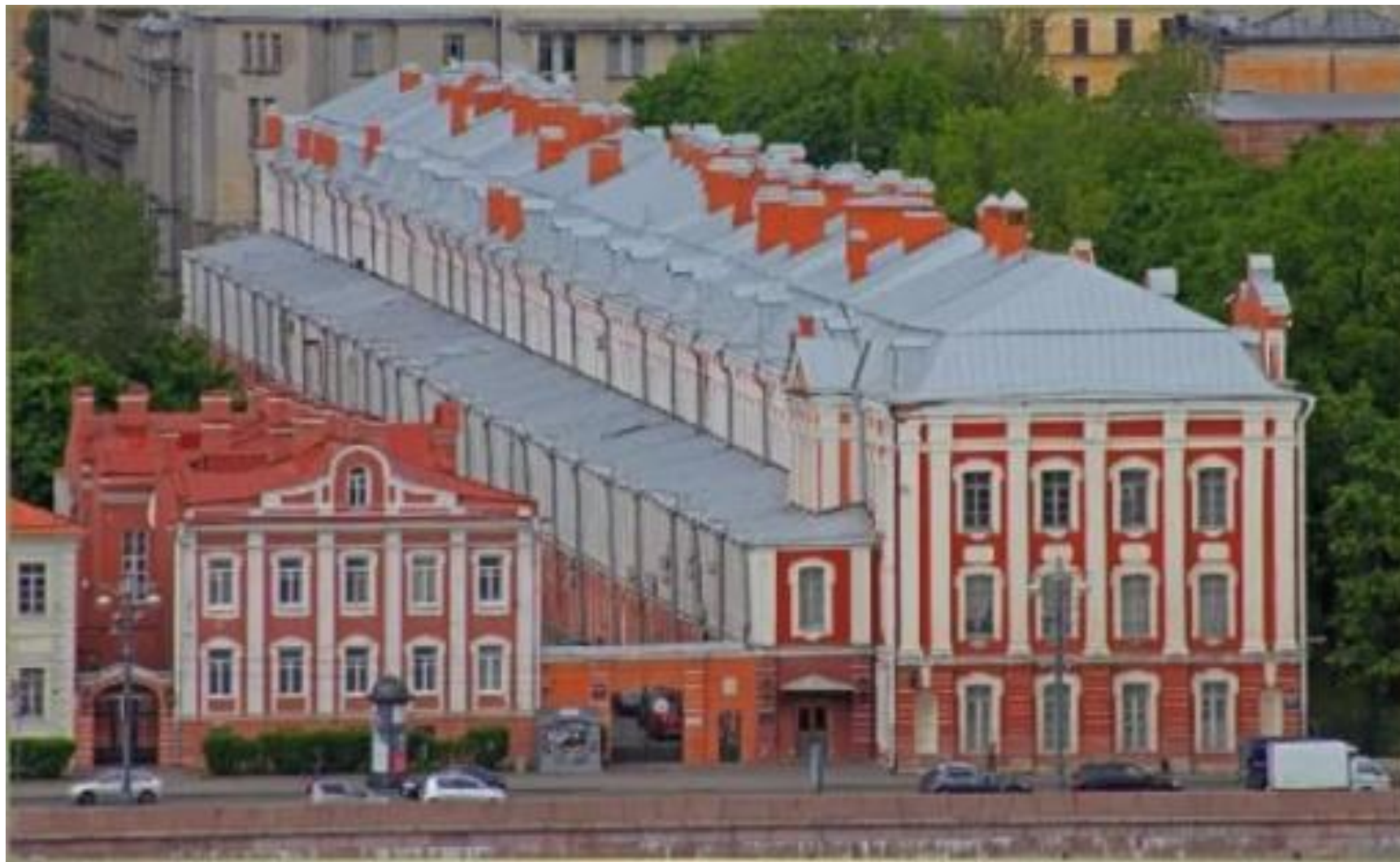
Здание Двенадцати коллегий. Архитектор Д. Трезини