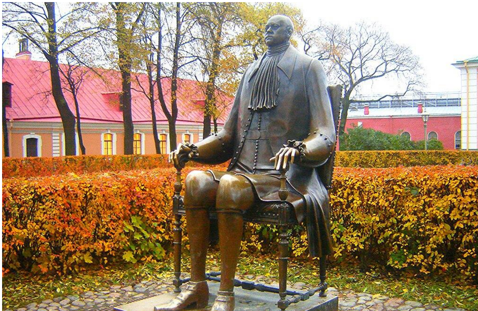
Памятник Петру I в Петропавловской крепости