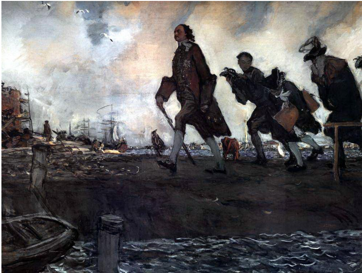
Петр I на строительстве Петербурга. Серов В.А.