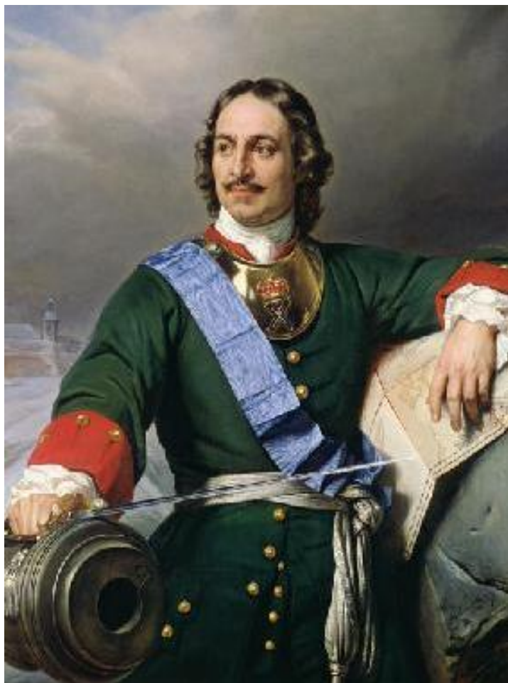
Портрет Петра I. Поль Деларош