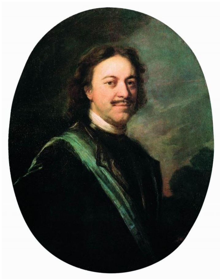
Портрет Петра I