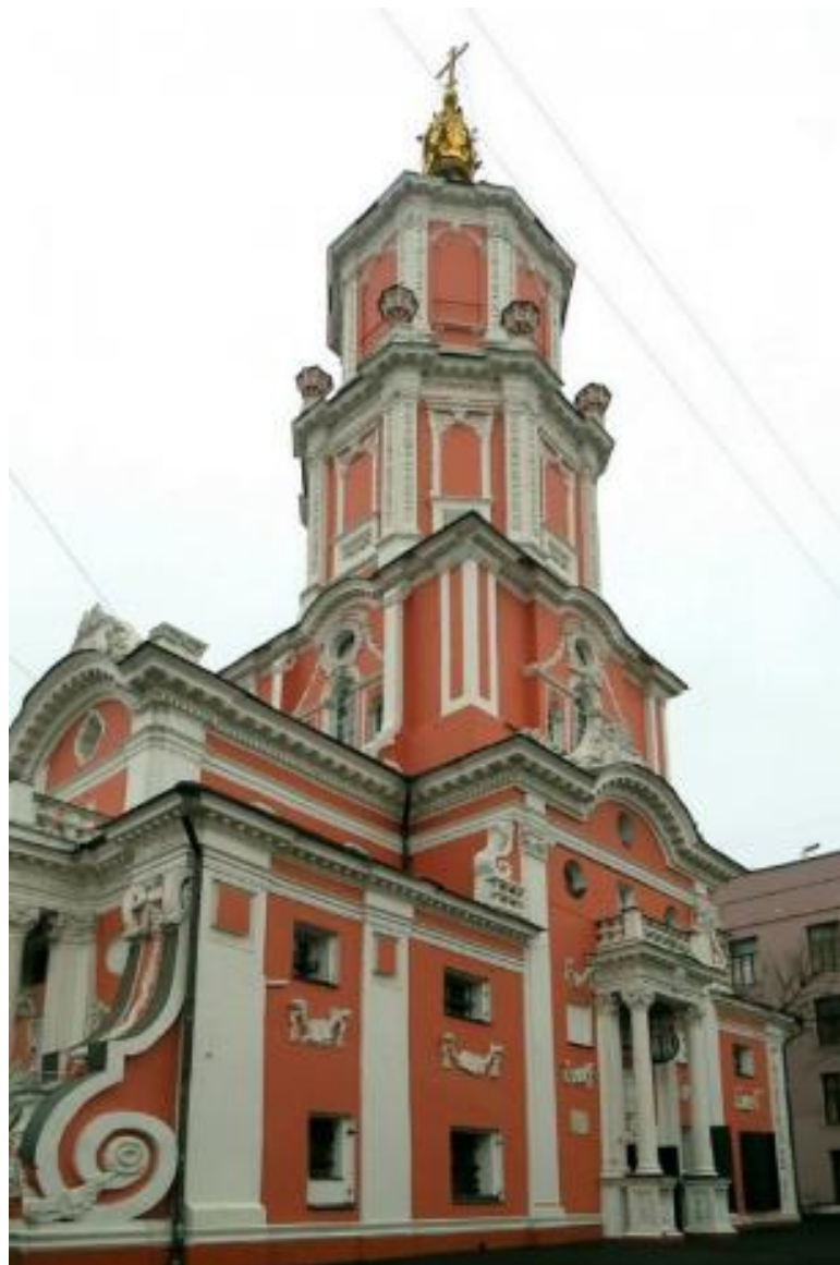
Церковь Архангела Гавриила (Меншикова башня) в Москве. Архитектор И. Зарудный