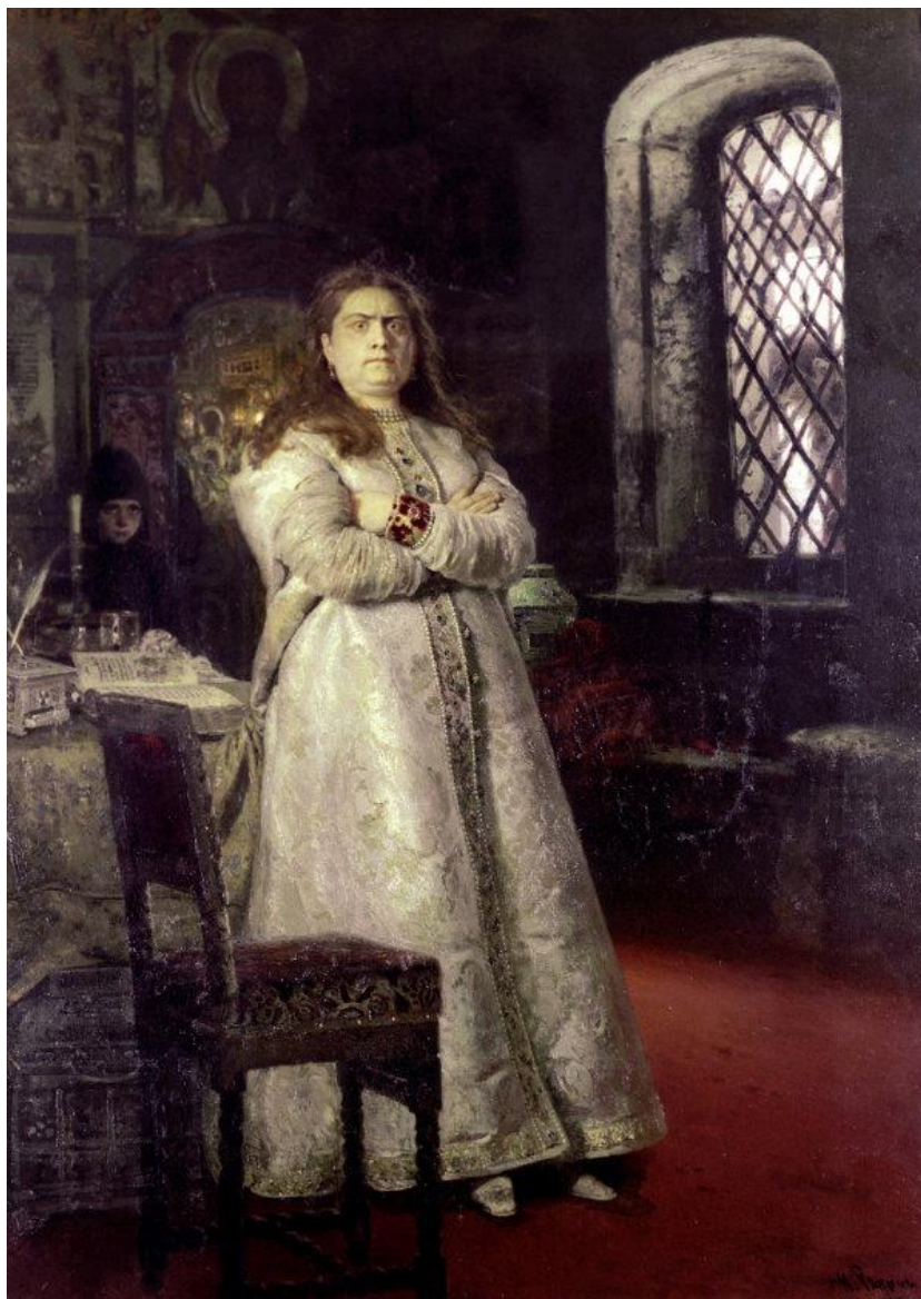
Царевна Софья Алексеевна в Новодевичьем монастыре. Репин И.Е.