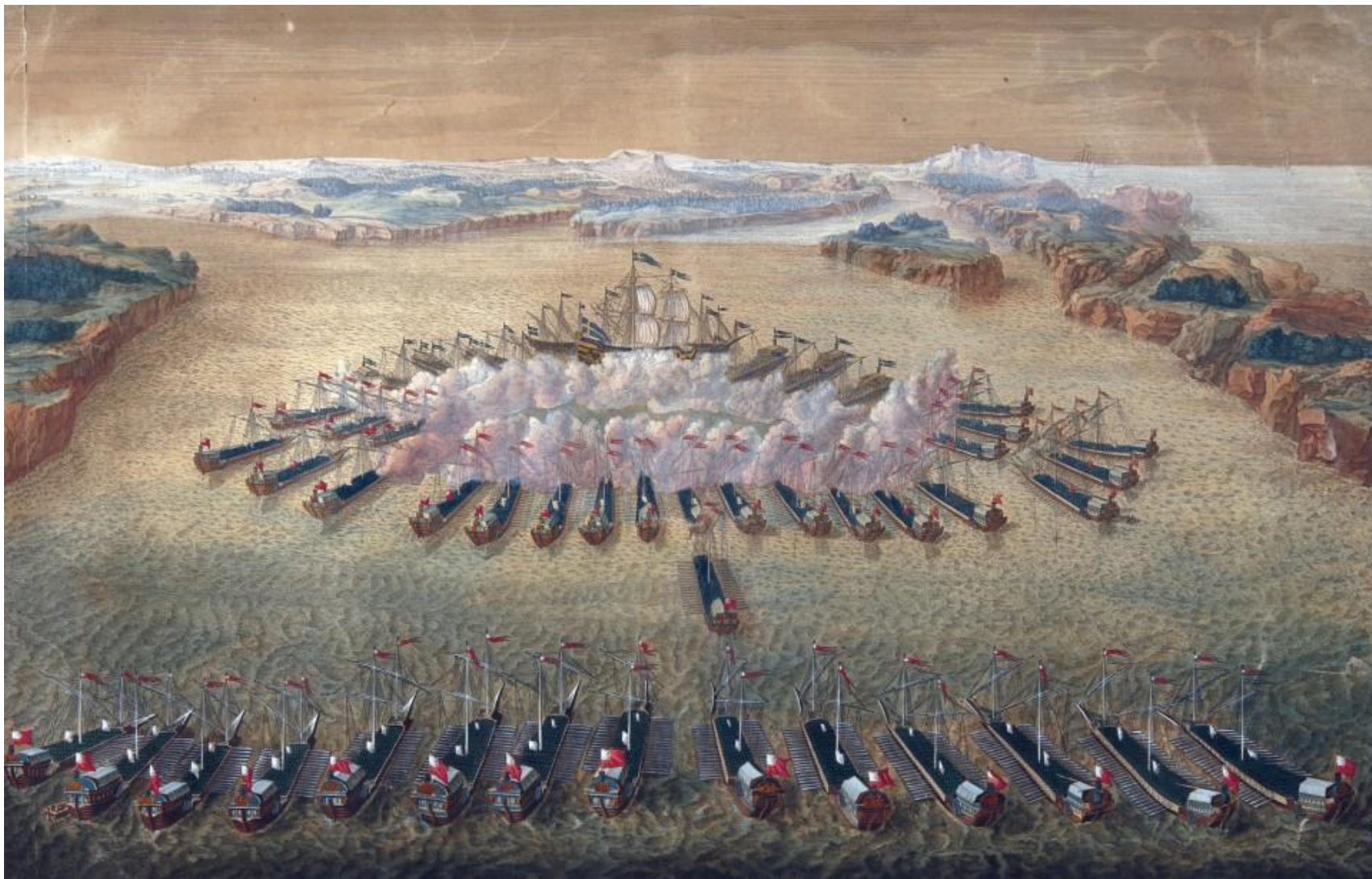
Сражение при мысе Гангут. Гравюра XVIII в.