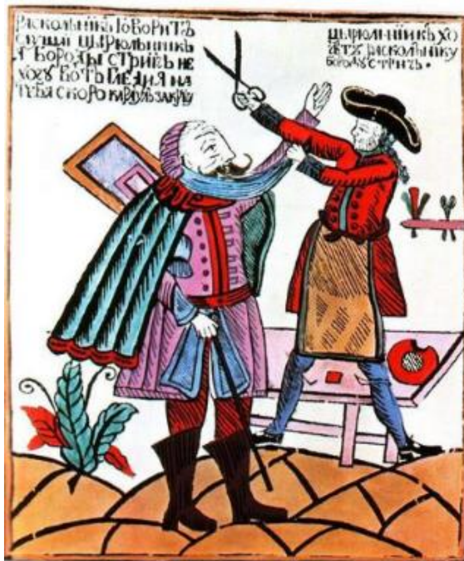
Насильственное бритье бород. Лубок XVIII в.