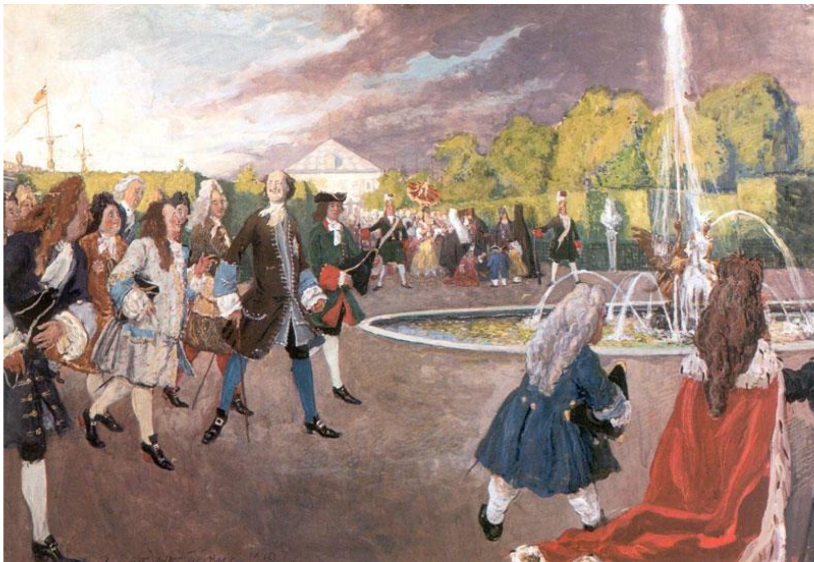
Петр I на прогулке в Летнем саду. Бенуа А.Н.