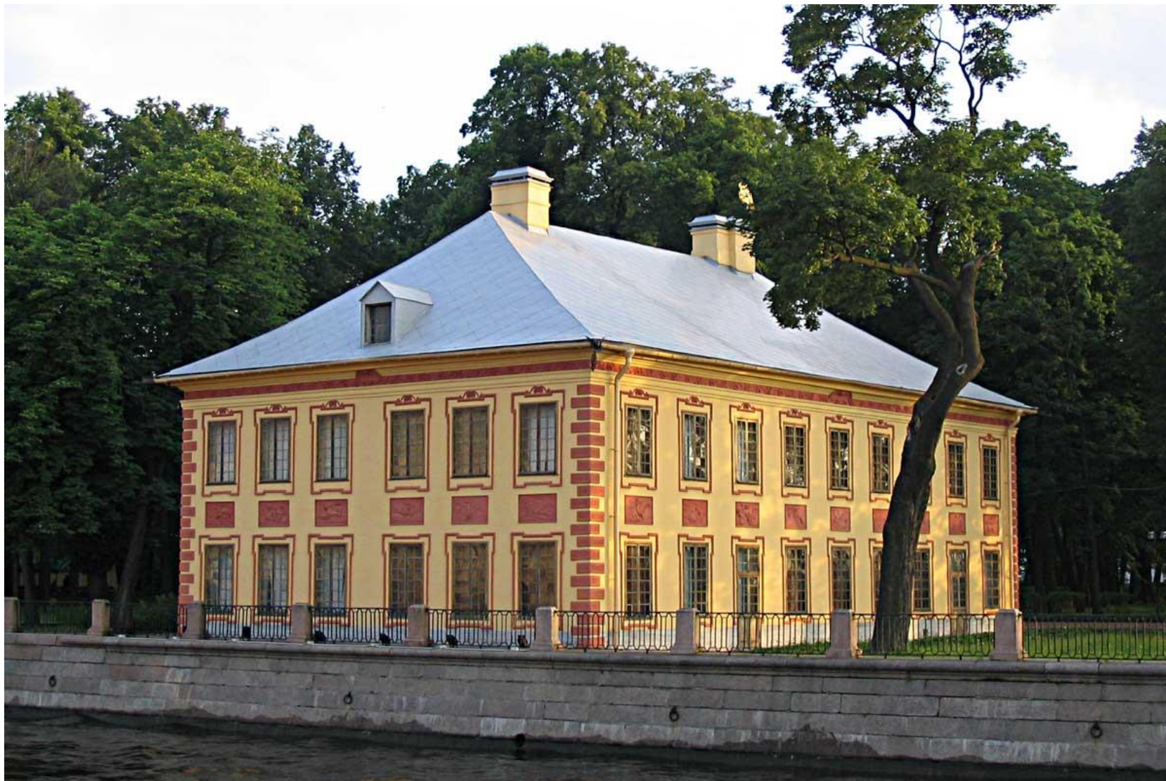
Летний дворец Петра I в Летнем саду. Архитектор Д. Трезини