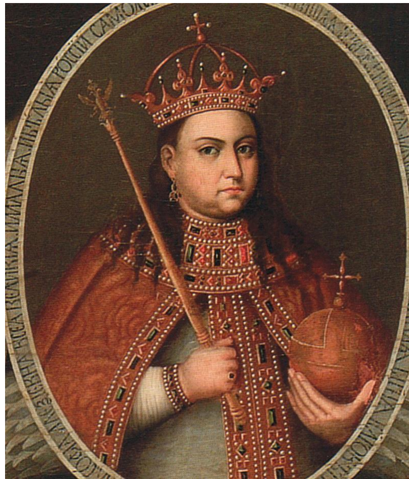
Царевна Софья Алексеевна