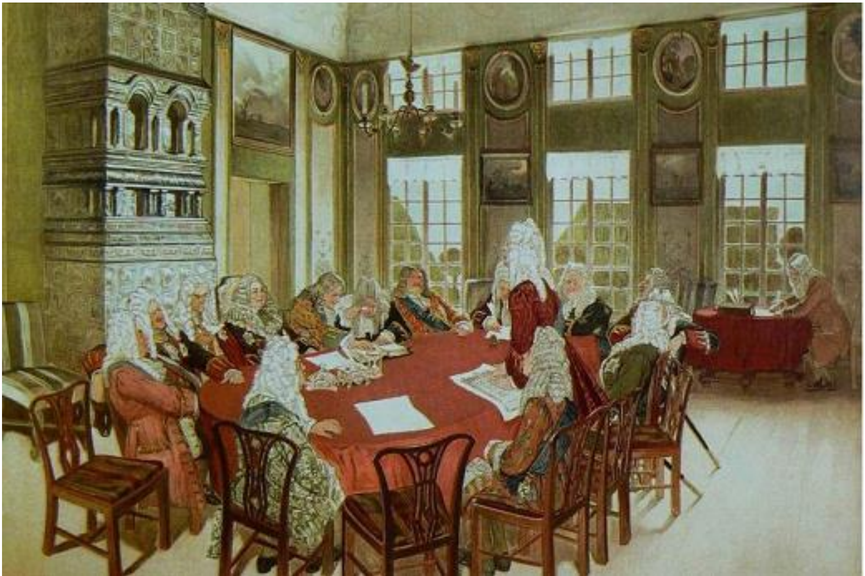
Заседание Сената при Петре I. Кардовский Д.Н.