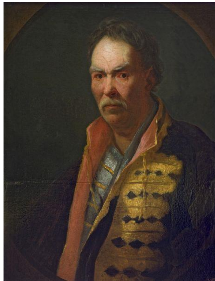
Портрет напольного гетмана