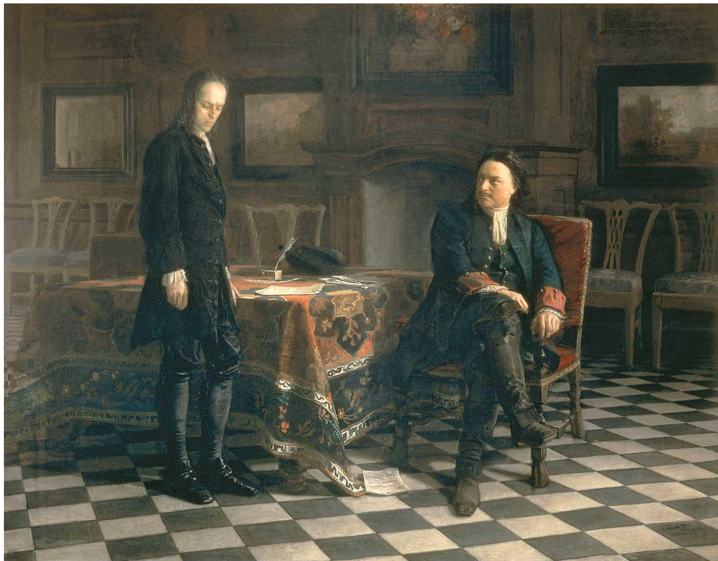
Петр I допрашивает царевича Алексея Петровича в Петергофе. Ге Н.Н.