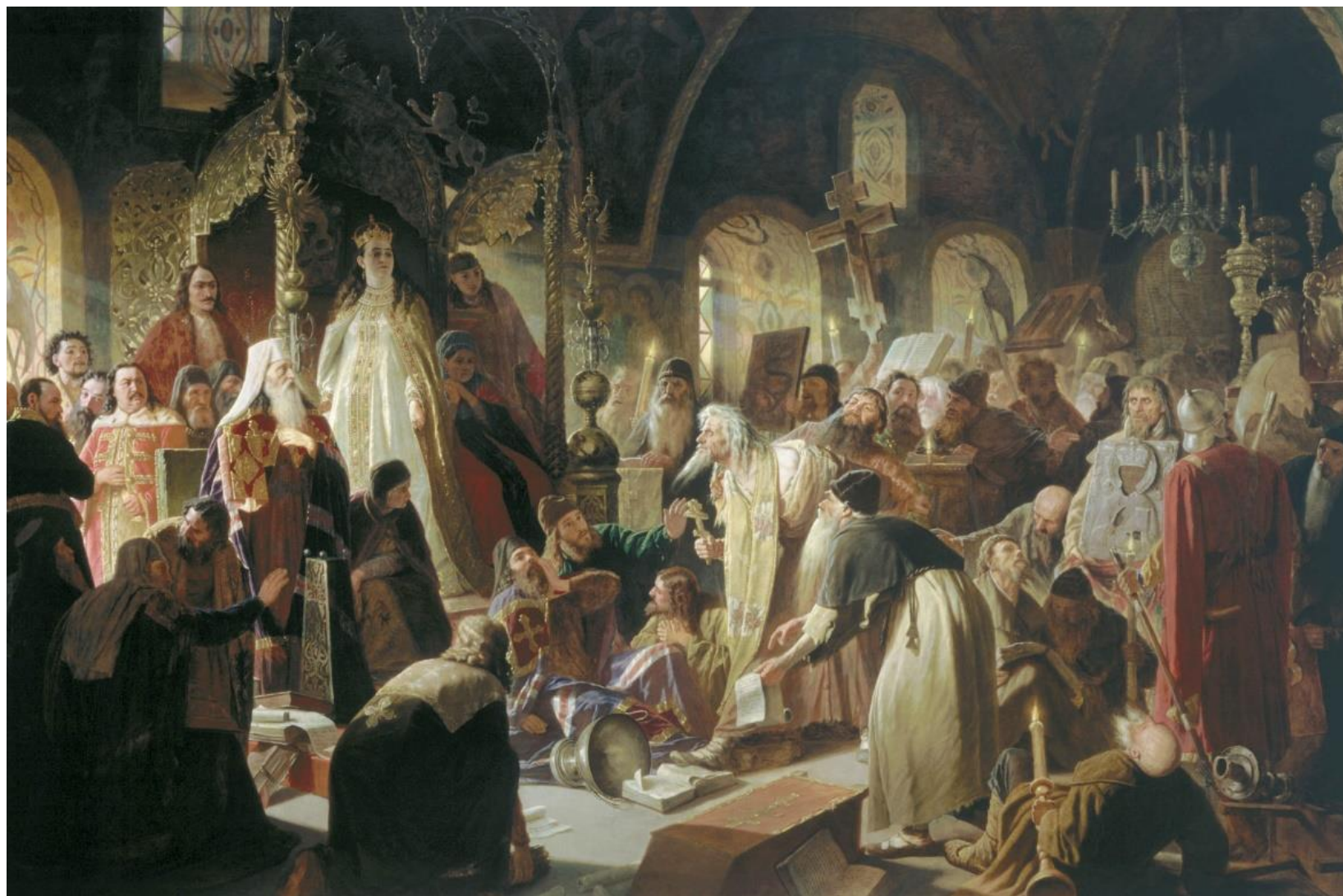
Никита Пустосвят (спор о вере). Перов В.Г.