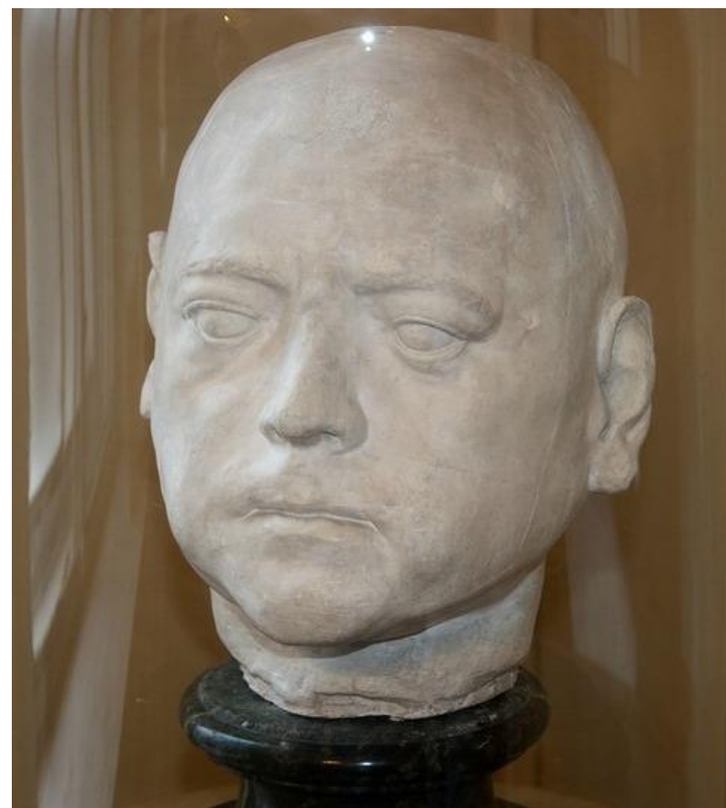
Посмертная маска Петра I