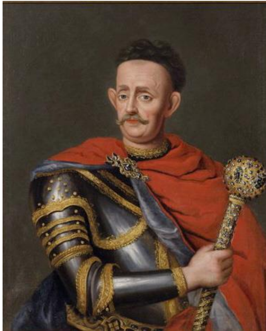
Гетман Украины Мазепа И.С.