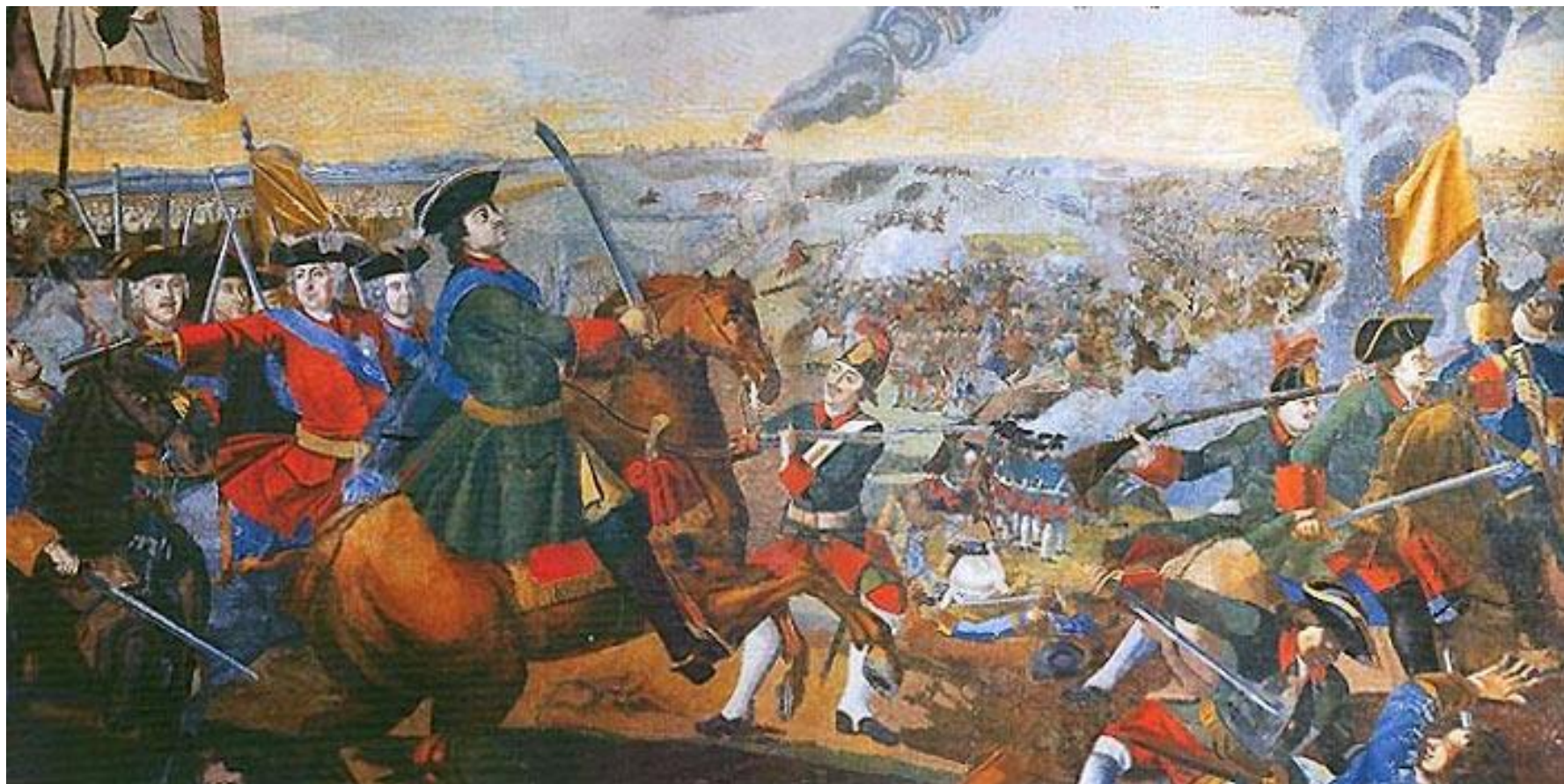
Полтавская битва. Мозаика мастерской М.В. Ломоносова