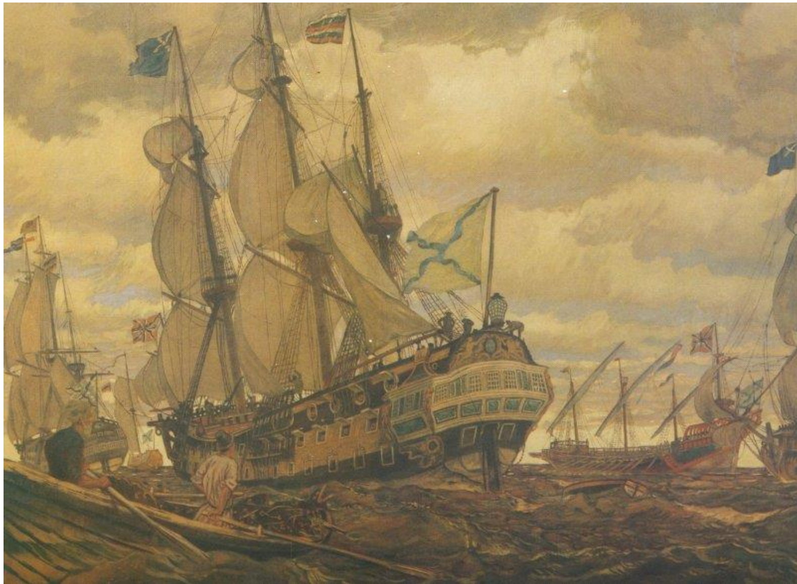
Флот Петра Великого. Лансере Е.Е.