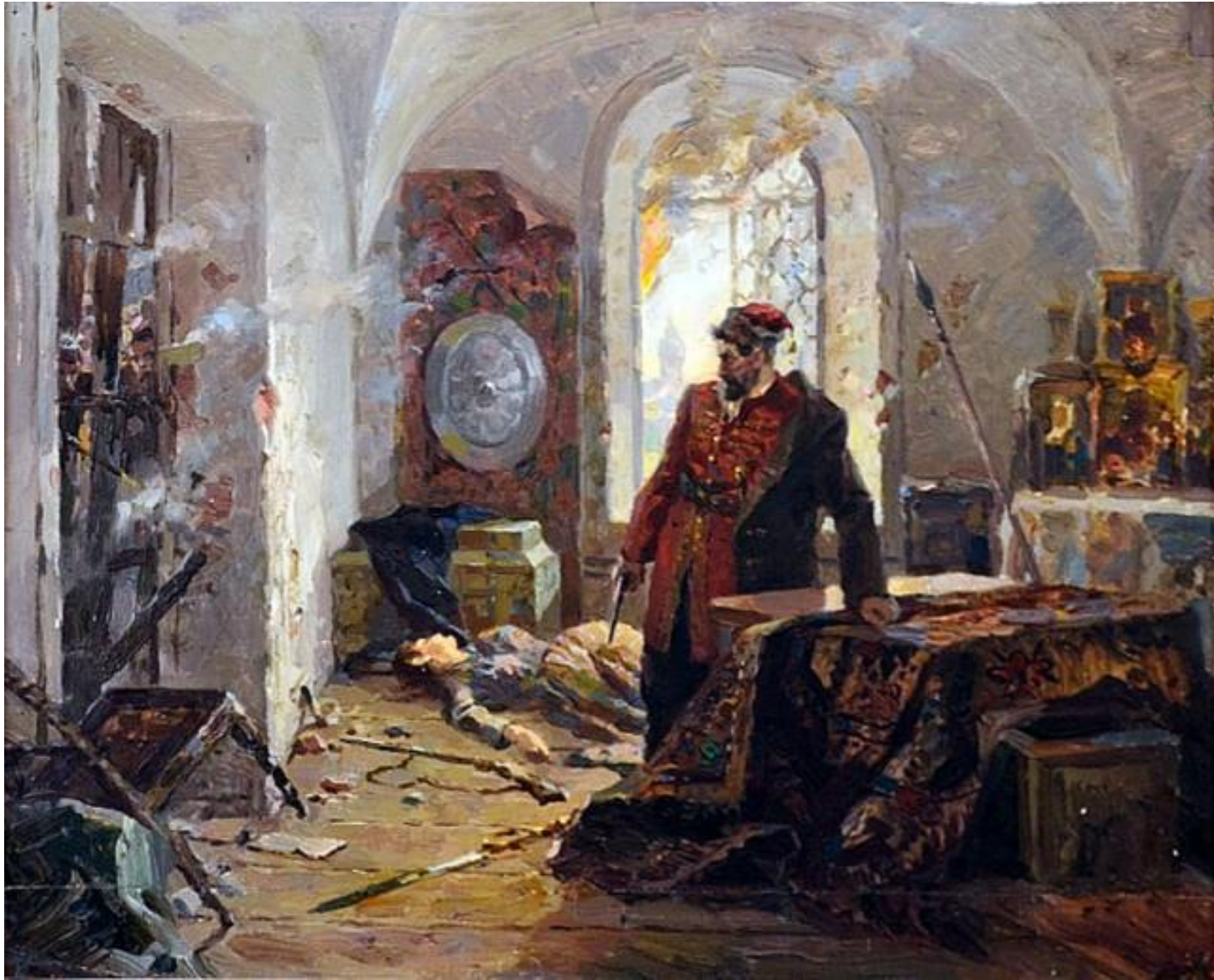
Гибель К.А. Булавина. Курочкин Г.Е.