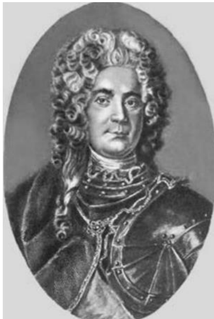
Ягужинский П.И. Генерал-прокурор Правительствующего Сената («око государево»)