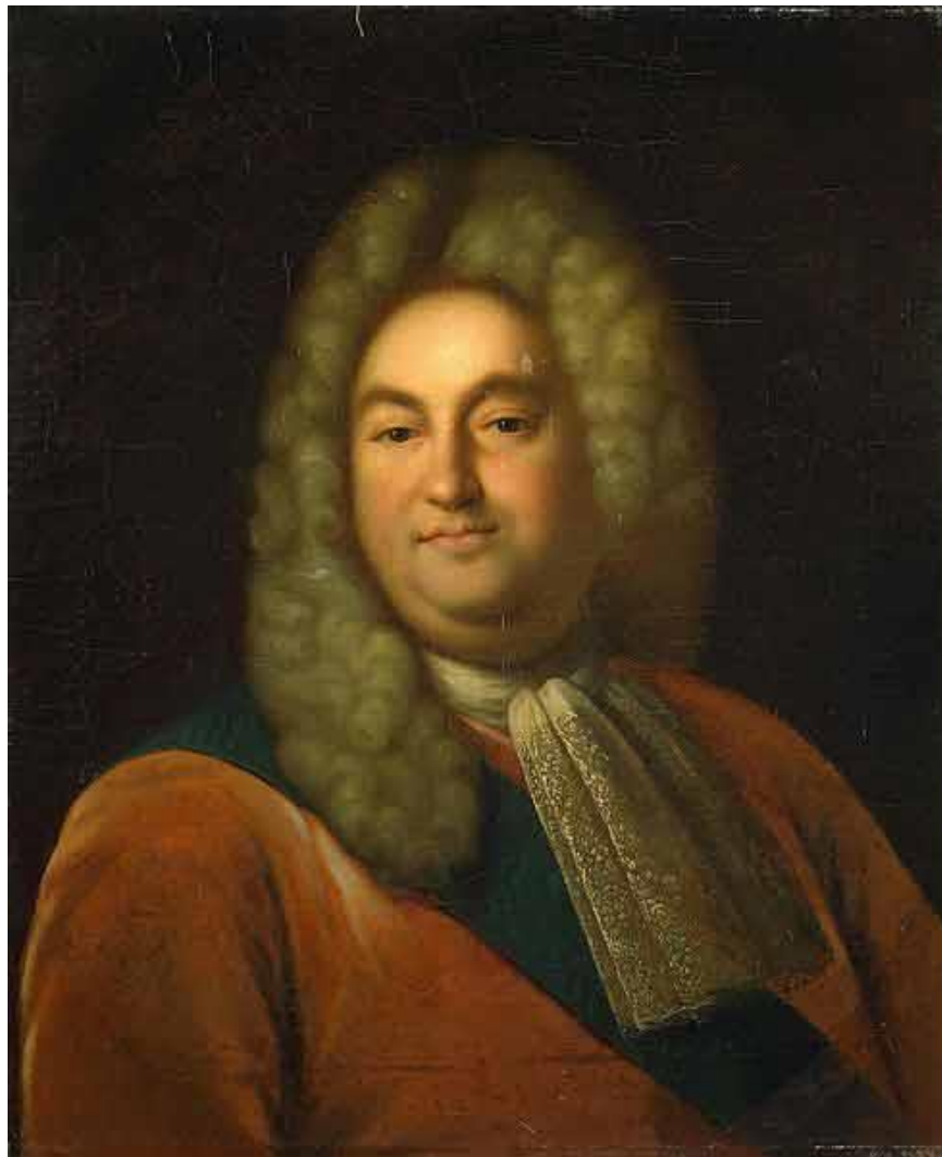
П.П. Шафиров – дипломат, вице-канцлер эпохи Петра I. Автор работы «Рассуждение о причинах Свейской (Северной) войны»