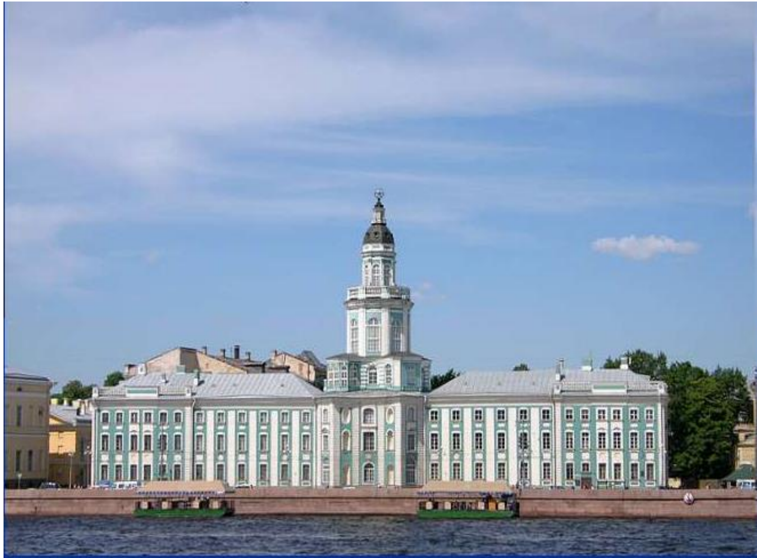
Кунсткамера. Архитектор Земцов М.Г. и др.