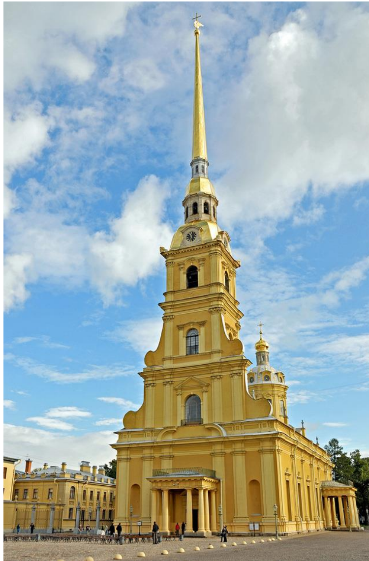
Петропавловский собор. Архитектор Д. Трезини