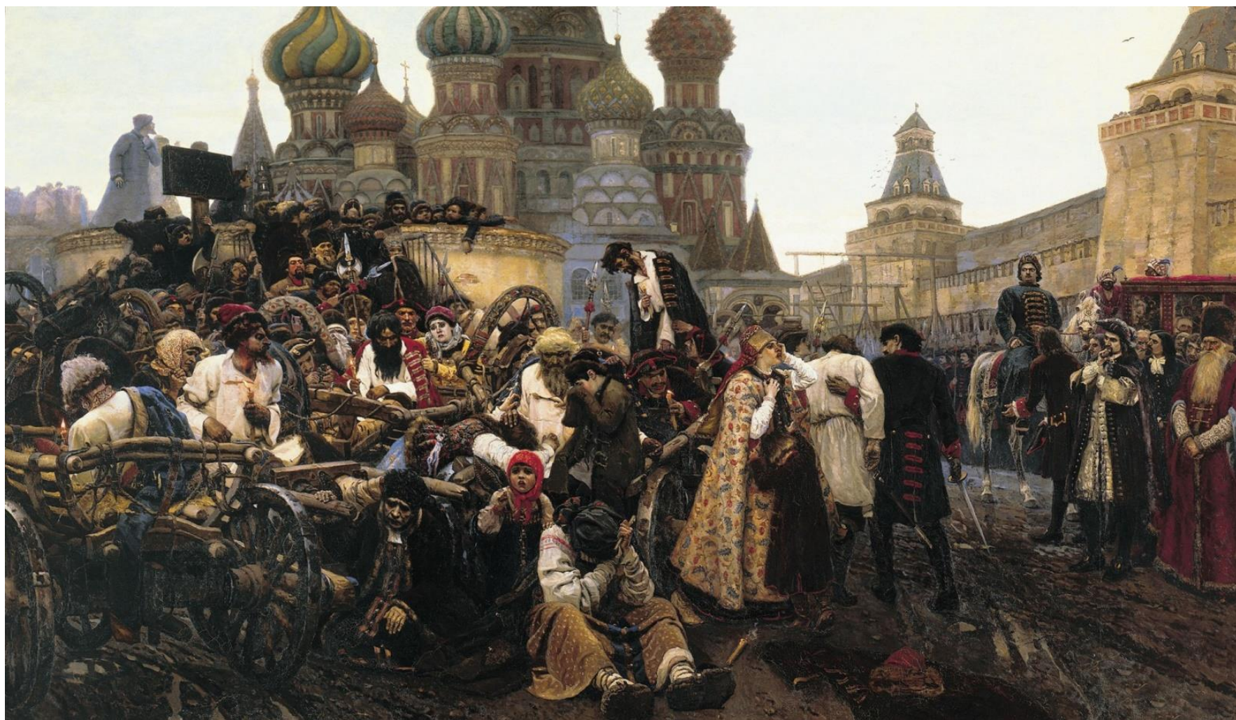
Утро стрелецкой казни. Суриков В.И.