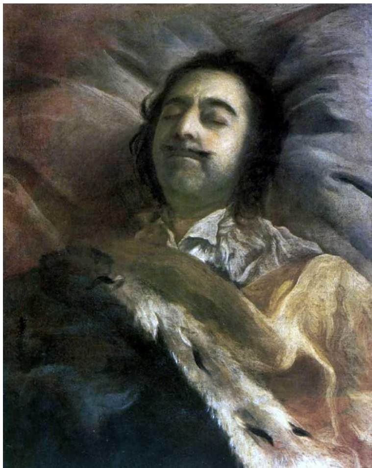
Петр I на смертном ложе