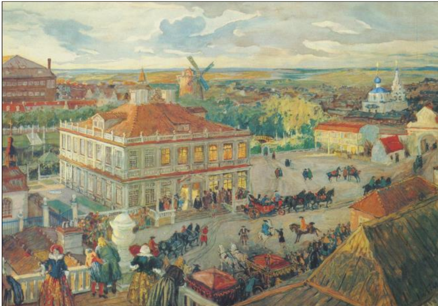
Немецкая слобода. Бенуа А.Н.