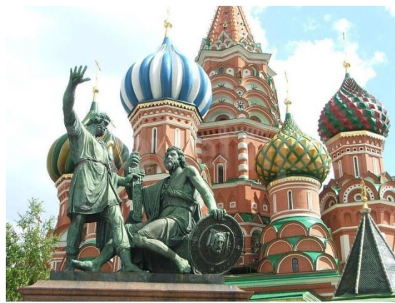
2. Памятник Минину и Пожарскому