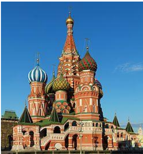
1. Храм Василия Блаженного

14. Какие из памятников созданы в честь событий, изображенных на картине. Выберите два.